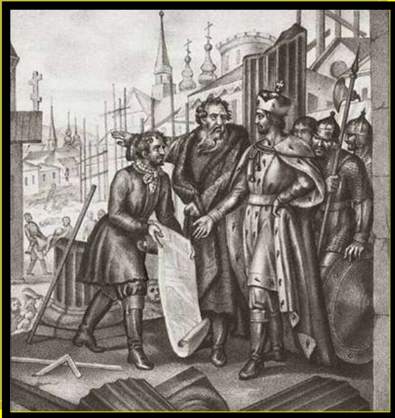
Ярослав восстанавливает Владимир после нашествия монгол

Во внутренней политике особенно примечательна многолетняя борьба Ярослава за право княжить в Новгороде.