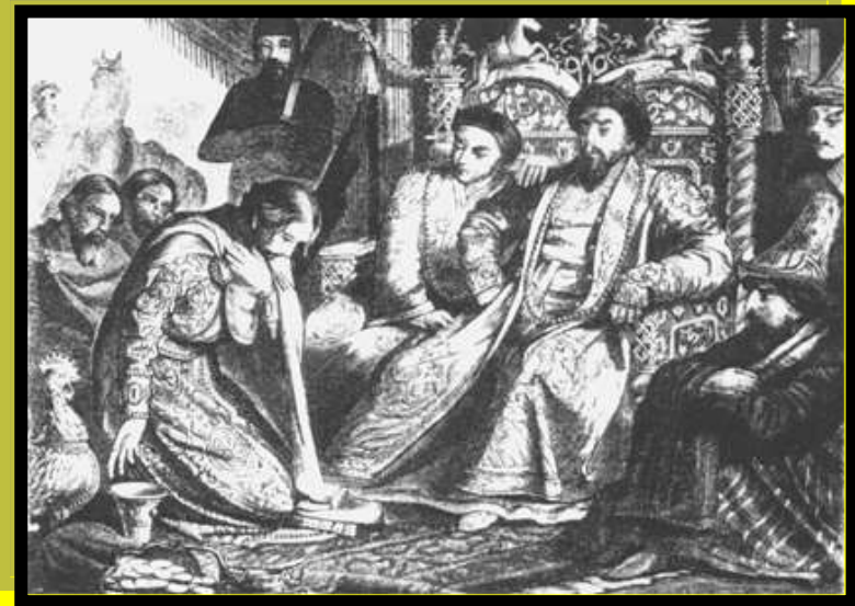
Вручение ярлыка на княжение

21 апреля 1216 года произошло знаменитое сражение на реке Липице между войсками Мстислава и Ярослава, в результате которого Ярослав потерпел поражение и вынужден был отдать титул князя Новгородского обратно Мстиславу.